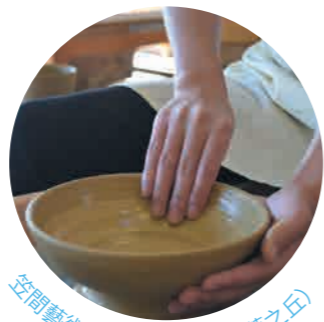
空間藝術之森公園 (空間工藝之丘)