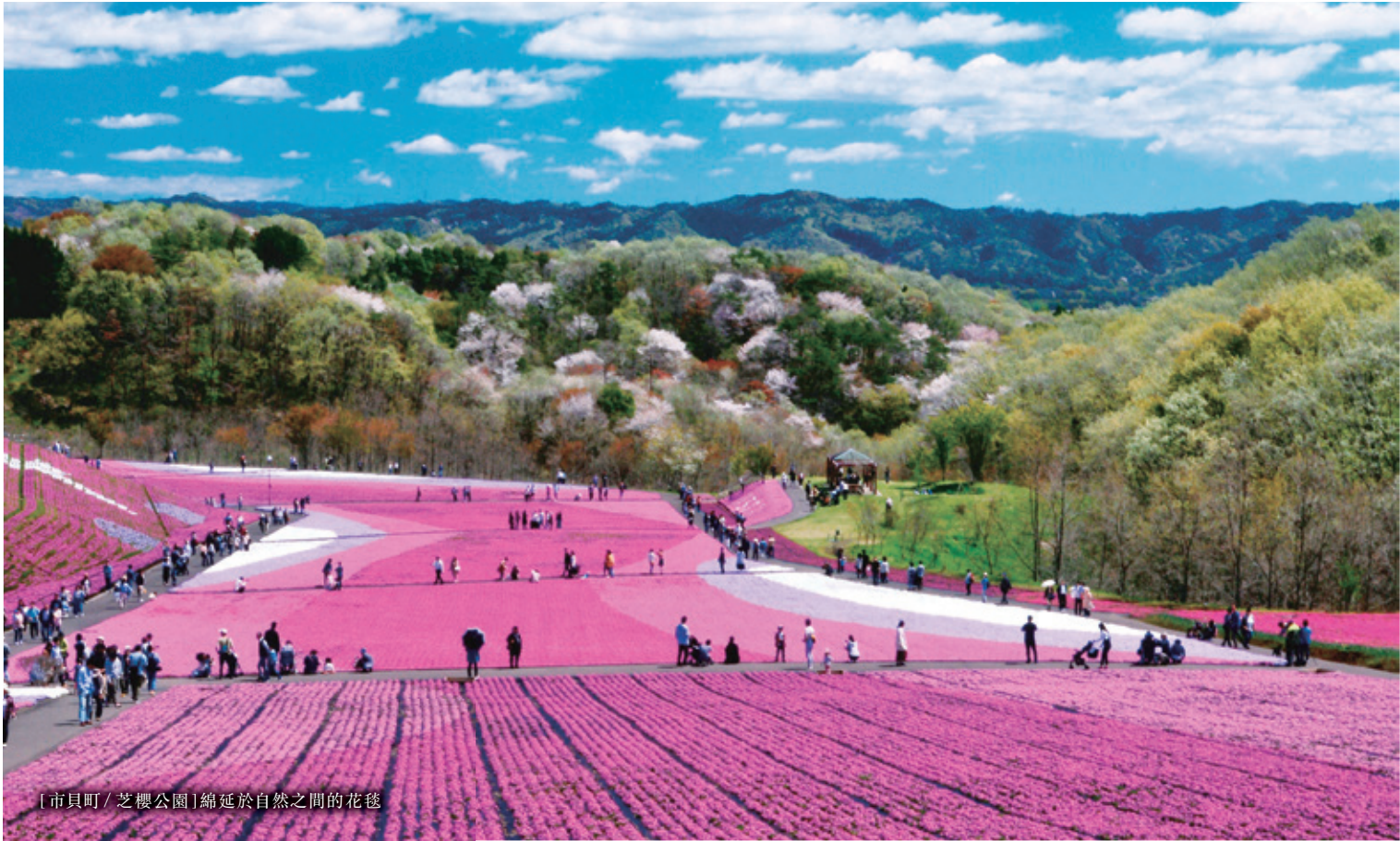
[市貝町 / 芝櫻公園] 綿延於自然之間的花毯