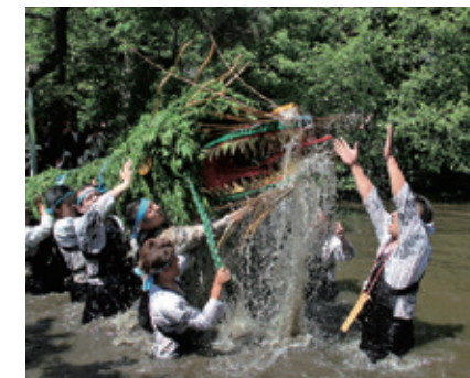
[小山市 / 間々田JAGAMAITA蛇祭]七條大蛇一齊舞動