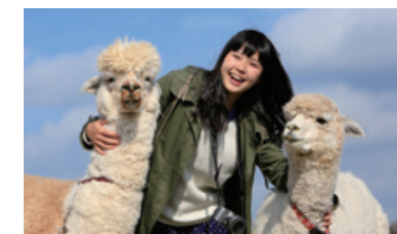
[那須町 / 那須動物王國] 與動物互動，療癒身心。