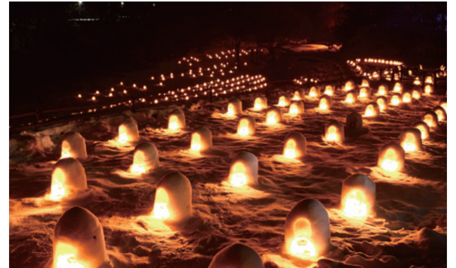
[日光市 / 湯西川溫泉雪洞祭]在訴說古老傳說的秘境中打造別樣世界