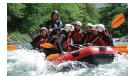
[日光市 / 急流泛舟] 在美麗的溪流中享受緊張刺激的快感