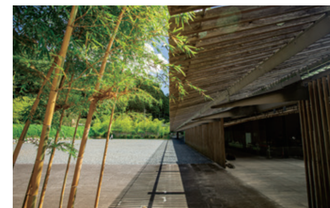
[那珂川町/ 馬頭廣重美術館]館內展示有許多浮世繪畫師歌川廣重的親筆畫等作品。