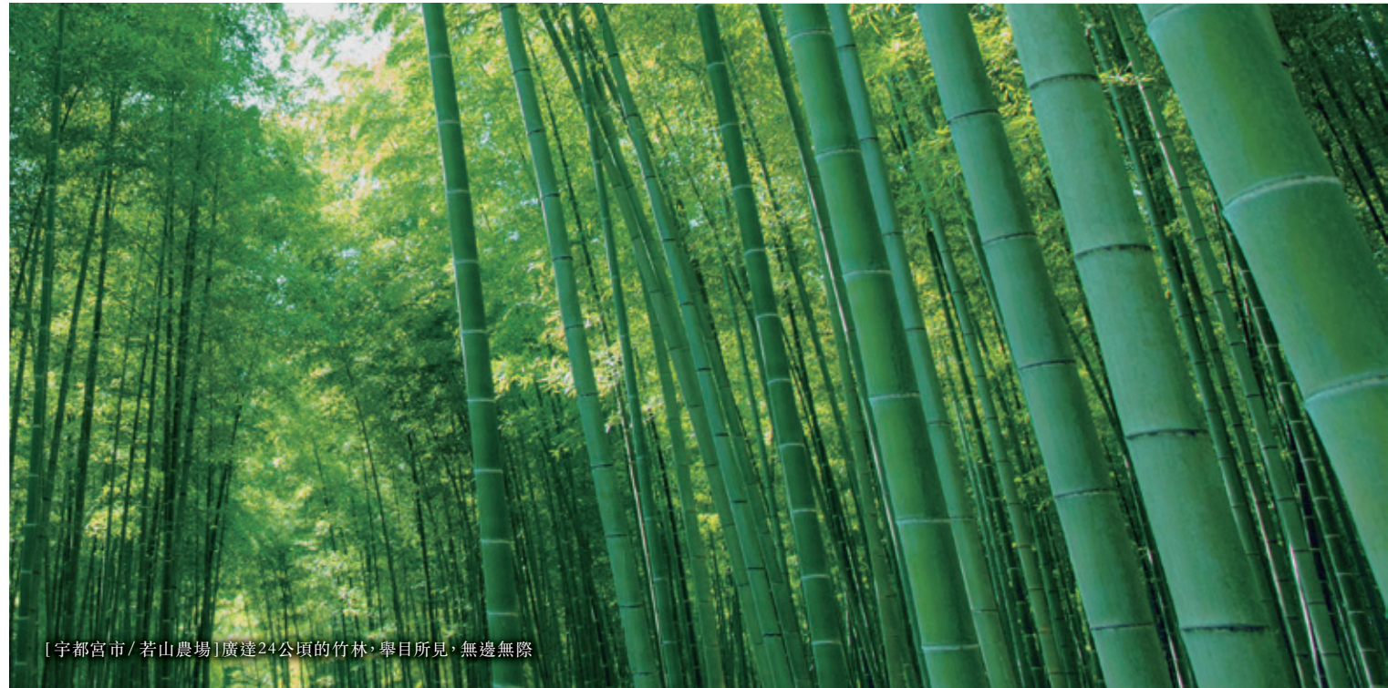
[宇都宮市 / 若山農場] 廣達24公頃的竹林，舉目所見，無邊無際