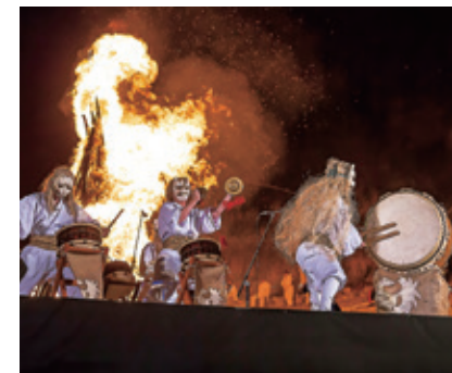
[那須町 / 御神火祭]如夢似幻的火焰祭典

當地居民藉著充滿特色的傳統祭典 打造出的異度空間， 可親身體會空氣中高昂的活力 與異國風情。