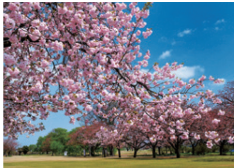
[下野市 / 天平之丘公園] 盛開1個月以上的燦爛櫻花