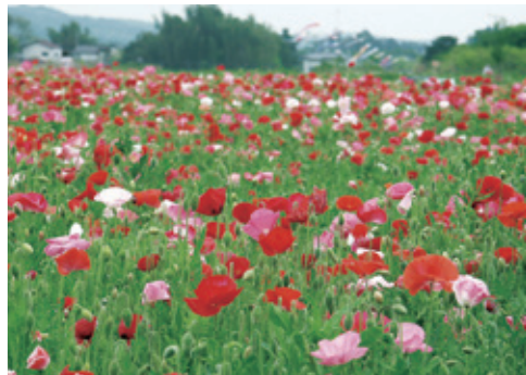
[櫻花市 / 罌粟花田] 300萬株罌粟匯聚而成的紅粉汪洋