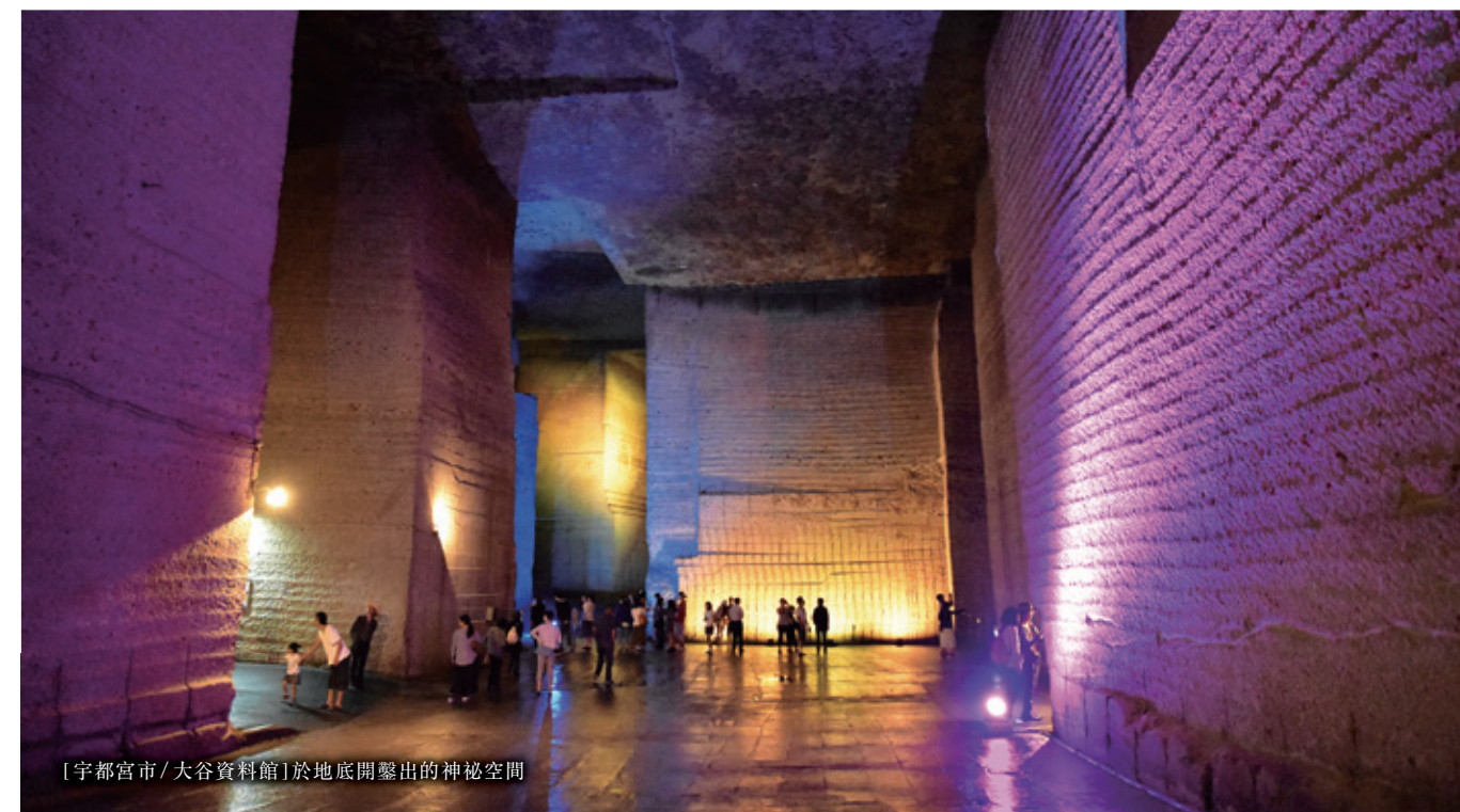
[宇都宮市/大谷資料館]於地底開鑿出的神秘空間