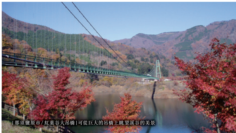
[那須鹽原市 / 紅葉谷大吊橋] 可從巨大的吊橋上眺望溪谷的美景