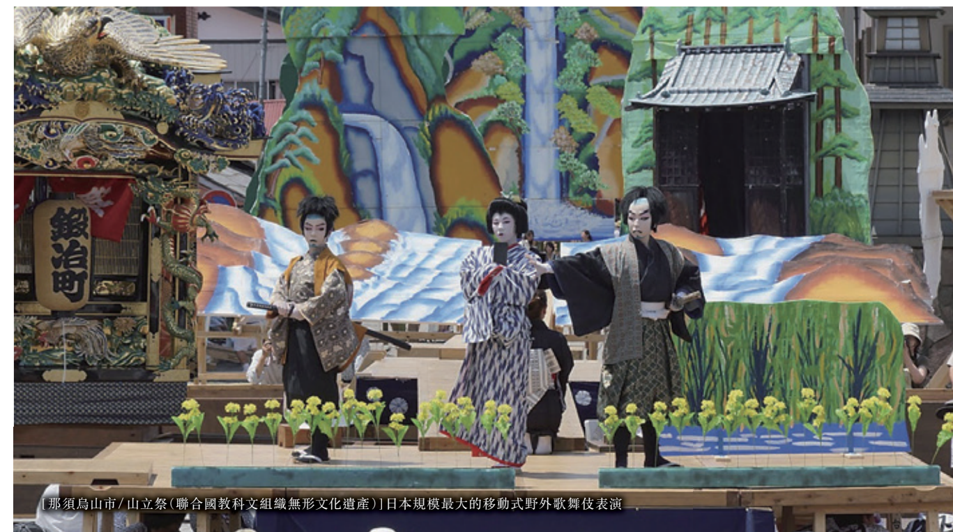
[那須烏山市 / 山立祭(聯合國教科文組織無形文化遺產)]日本規模最大的移動式野外歌舞伎表演