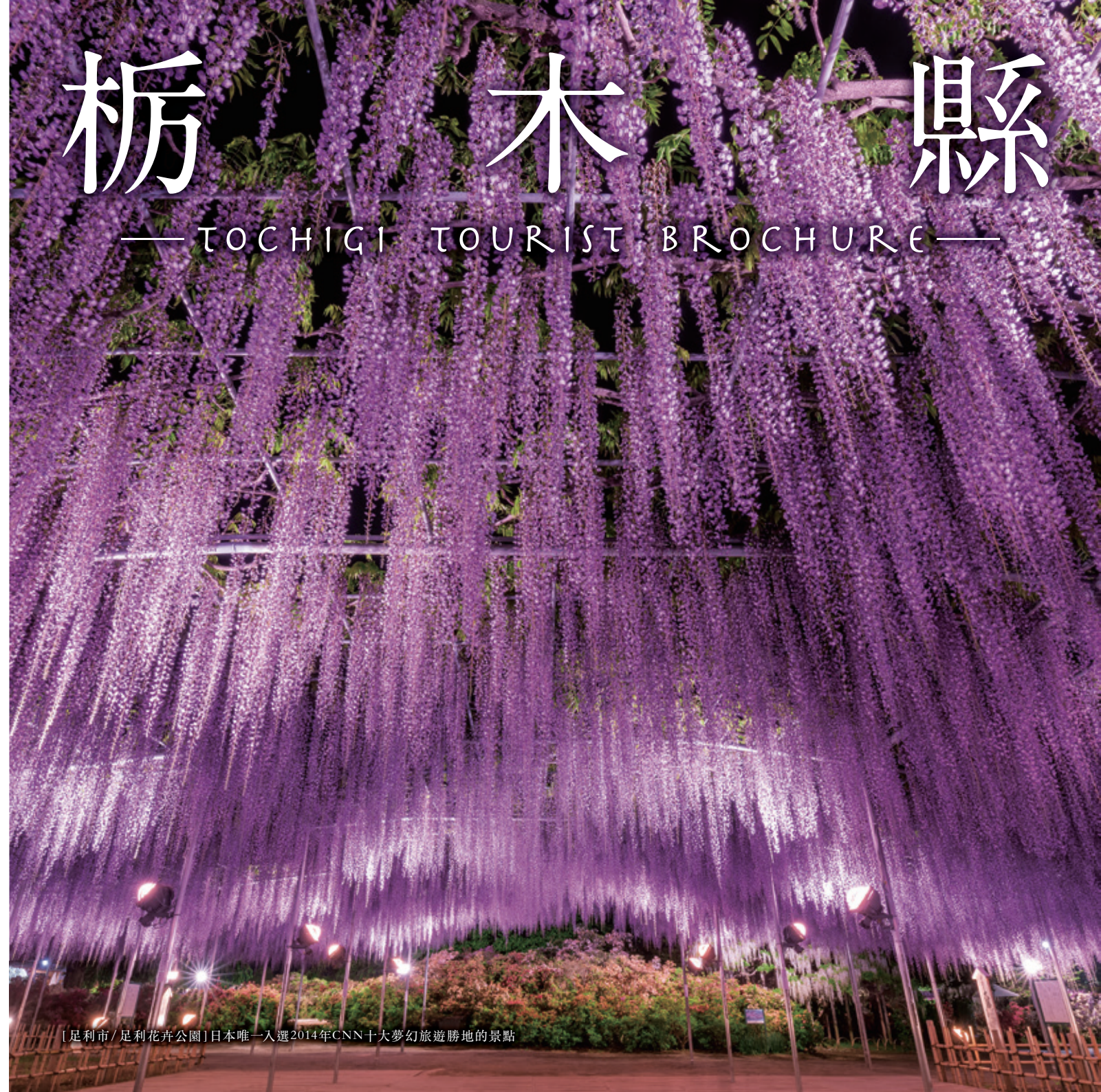
[足利市/足利花卉公園] 日本唯一入選2014年CNN十大夢幻旅遊勝地的景點