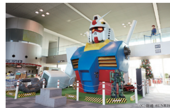
[壬生町/ 玩具之城萬代博物館]等身大的鋼彈模型不容錯過