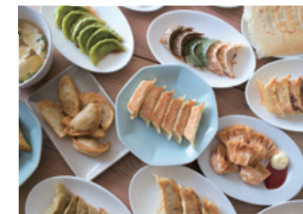
[宇都宮市 / 宇都宮餃子*] 宇都宮市因被稱為「餃子城市」而聞名。