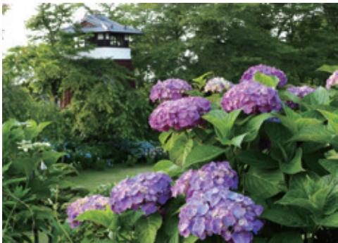
[大田原市 / 黑羽城址公園] 在城堡遺跡中靜靜地綻放的紫陽花