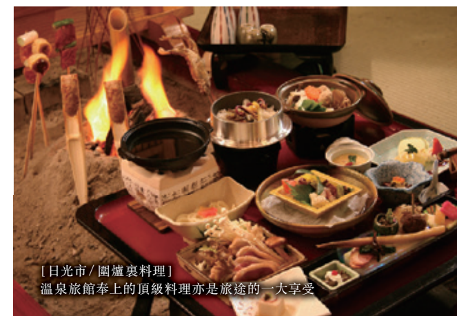
[日光市 / 圍爐裏料理] 溫泉旅館奉上的頂級料理亦是旅途的一大享受