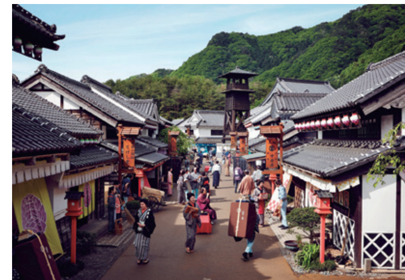
[日光市/ EDO WONDERLAND日光江戸村]欣賞忠實重現的街市景象，體驗江戸風情。