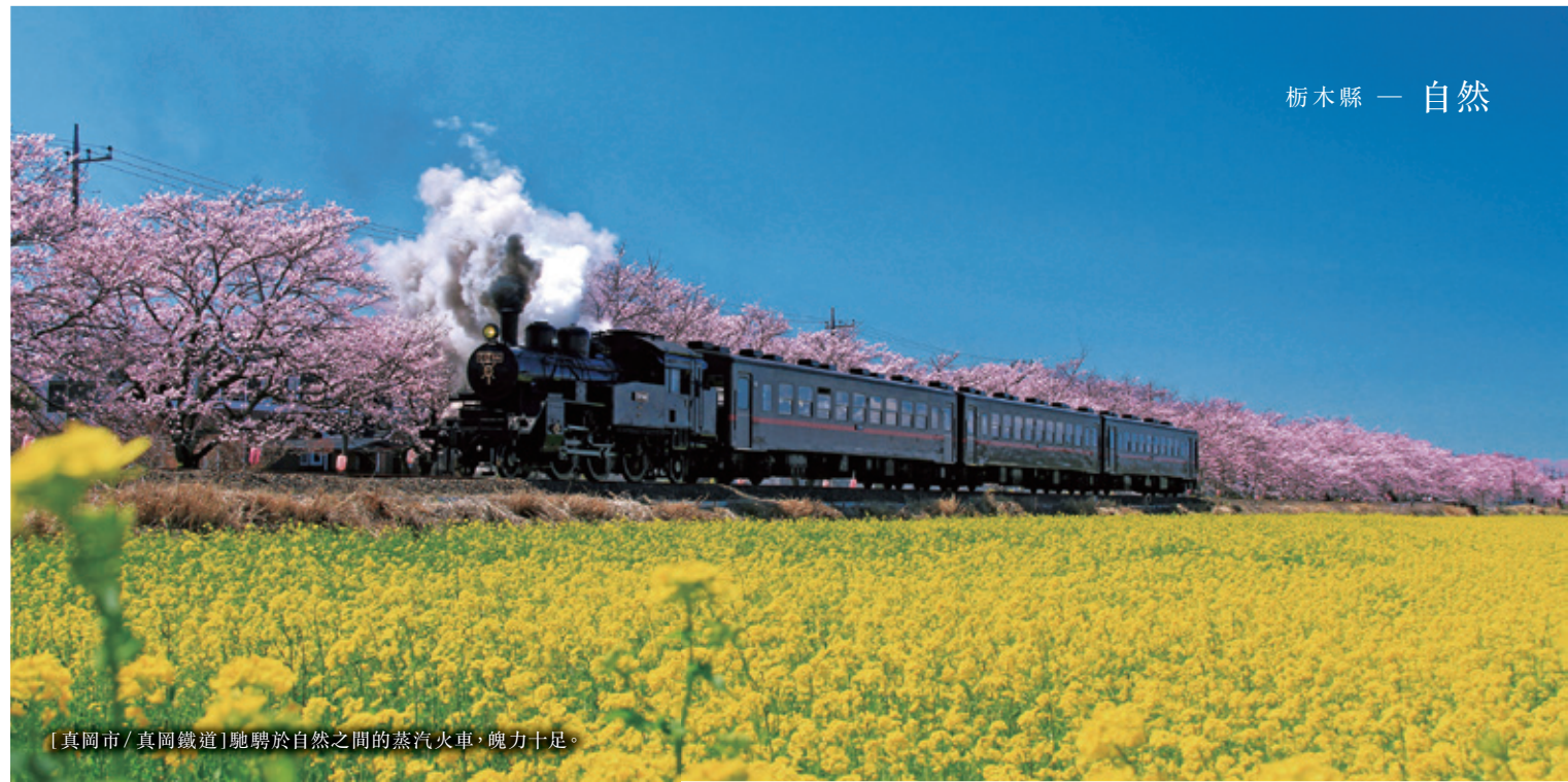
[真岡市 / 真岡鐵道] 馳騁於自然之間的蒸汽火車，魄力十足。