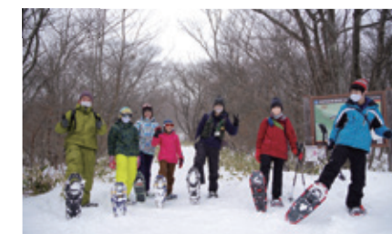
[那須町 / 雪鞋健行] 穿上專用的雪鞋在白雪的世界中漫步。