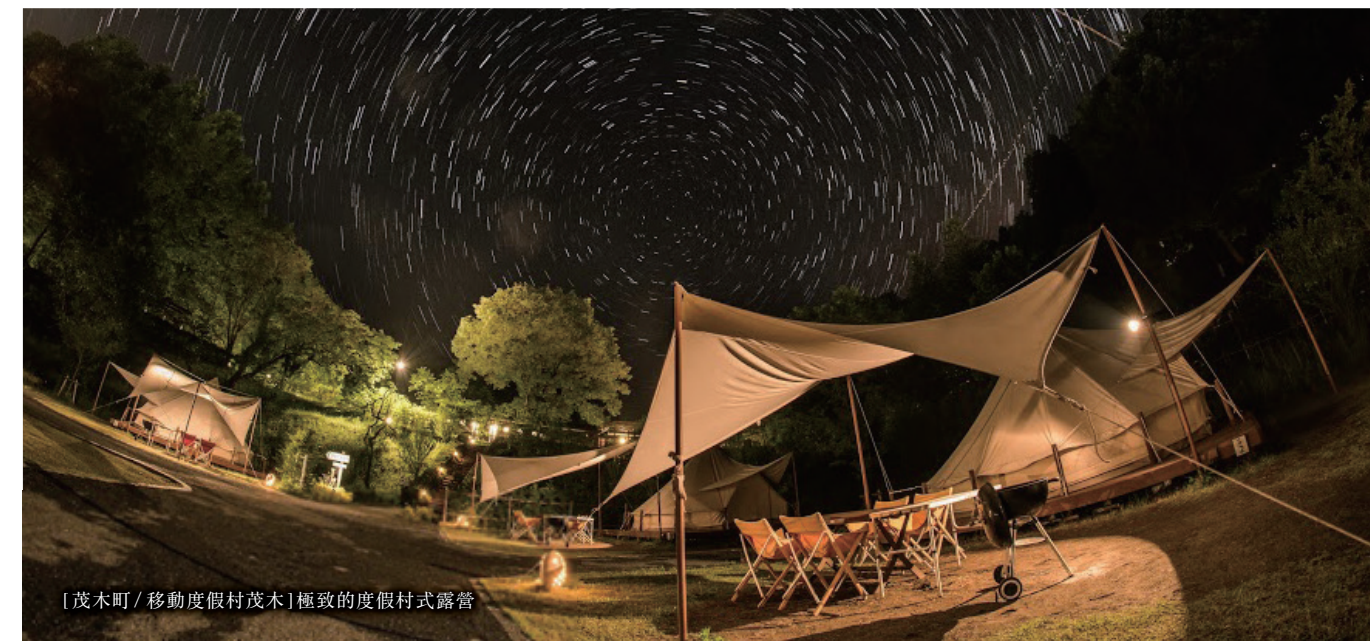
[茂木町 / 移動度假村茂木] 極致的度假村式露營