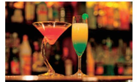
[宇都宮市 / 雞尾酒吧] 全日本最多調酒師執業的城市