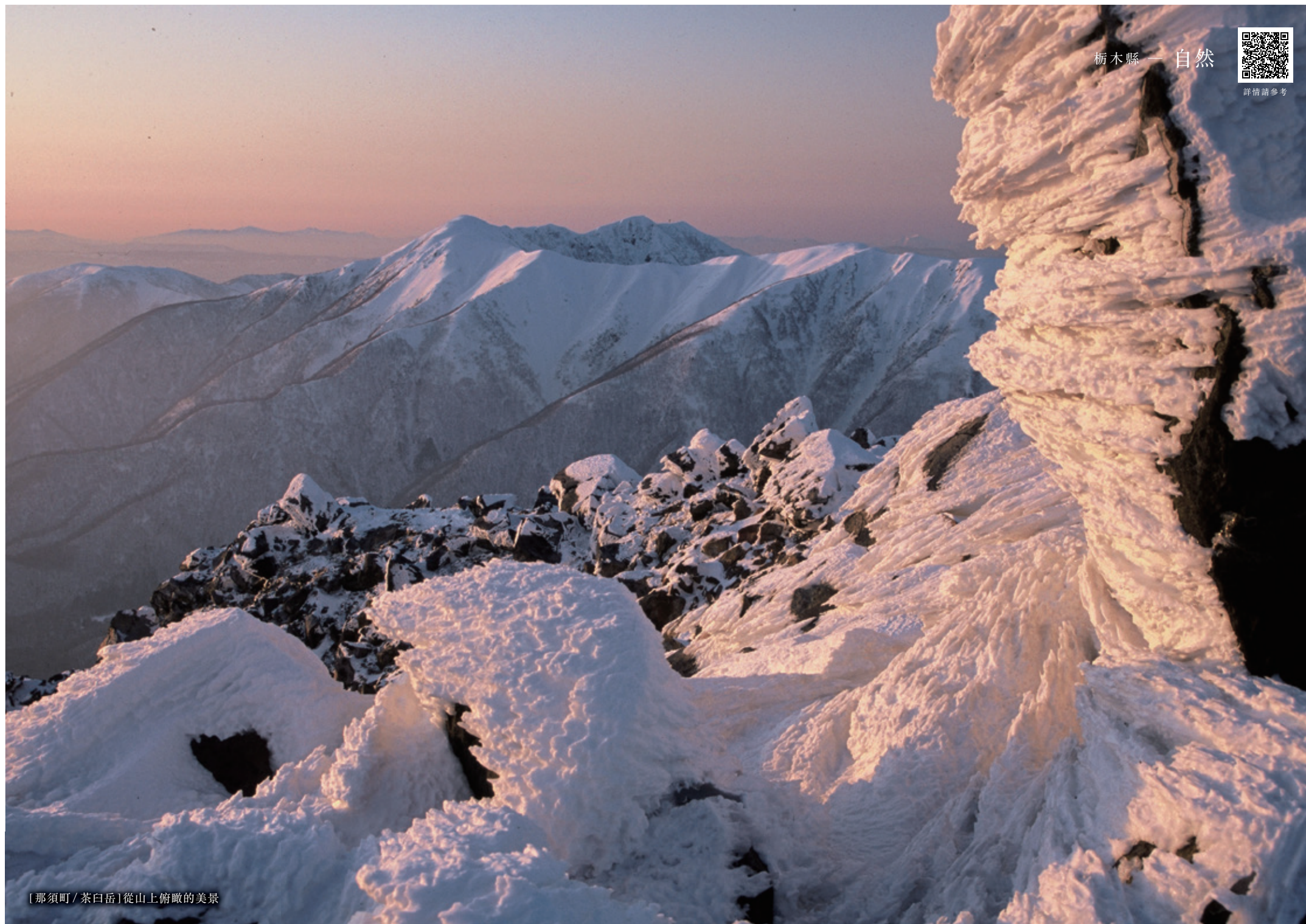
[那須町 / 茶臼岳] 從山上俯瞰的美景