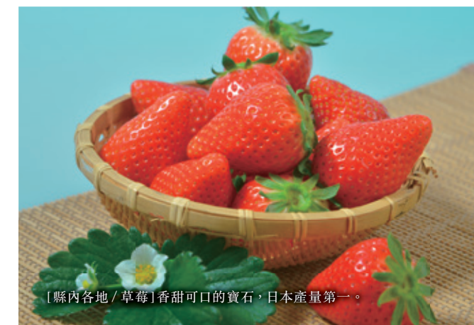
[縣內各地 / 草莓] 香甜可口的寶石，日本產量第一。