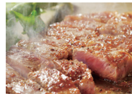
[縣內各地 / 櫻木和牛] 通過嚴格審查的獨特和牛