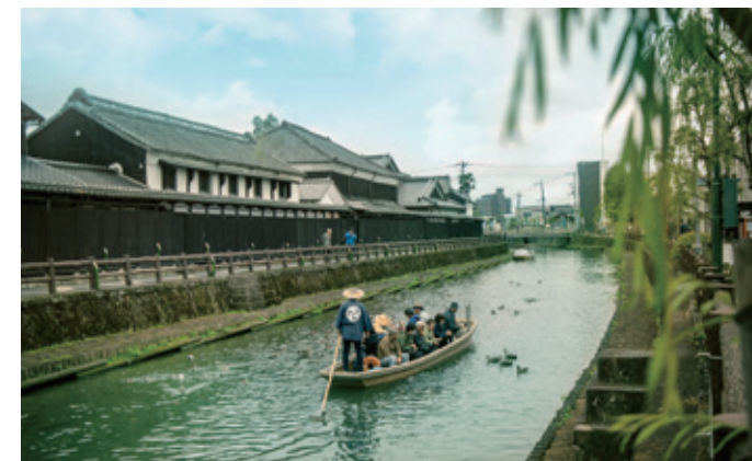
[栃木市/倉庫之城]江戶時代的街景依舊留存

造訪古蹟， 緬懷先人遺留的歷史事蹟。 無數可歌可泣的故事尚待發掘， 怎能不叫人心馳神往？