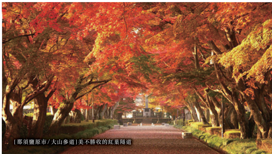
[那須鹽原市 / 大山參道] 美不勝收的紅葉隧道