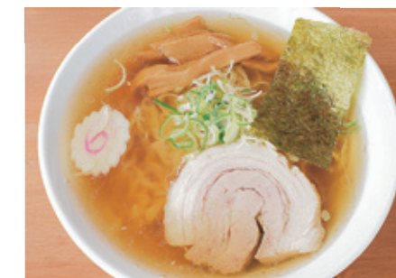
[佐野市 / 佐野拉麵] 日本人也十分喜愛